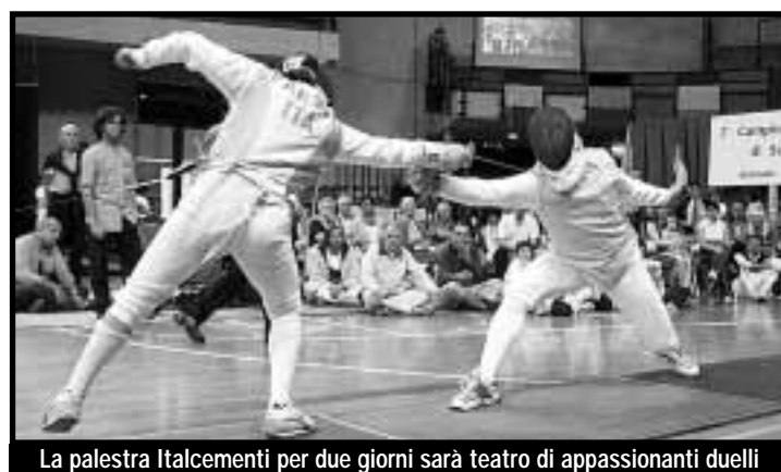
La palestra Italcementi per due giorni sarà teatro di appassionanti duelli

L'edizione 2005 del Città dei Mille alza il sipario stamane con la punzonatura (ore 9). A seguire le prime gare, con le finali previste a partire dalle 16. Si comincia, oggi, con la spada maschile Giovanissimi, una delle gare più attese, e Maschietti. In campo maschile il programma di giornata è completato dal fioretto allievi. In campo